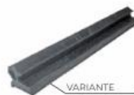
VARIANTE TERMINALE IN COMMA.